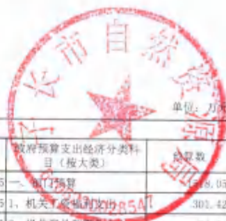
2020年部门综合预算收支总表